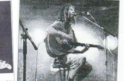
As de Trèfle, des textes teintés d'humour, des paroles vives ancrées dans la tête et un rythme effréné.

As de Trèfle, des textes teintés d'humour, des paroles vives ancrées dans la tête et un rythme effréné. As de Trèfle a été accueilli par un public très nombreux.