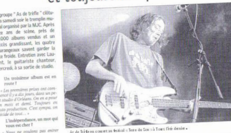
As de Trèfle en concert au festival Terre de Gon à Torcé-Tréden.

Le groupe "As de Trèfle" célébrera samedi soir le trentième anniversaire de son premier album. As de Trèfle a été accueilli par un public très nombreux.