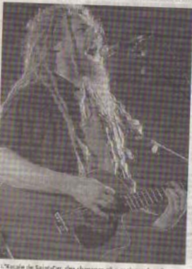
A l'escalade de Saint-Erme, des chanteurs plus rock que jamais.

Les 30 et 31 octobre, les petits Tourangeaux d'As de Trèfle reviennent au pays pour enregistrer le DVD live de leur dernier album, "Houlala".