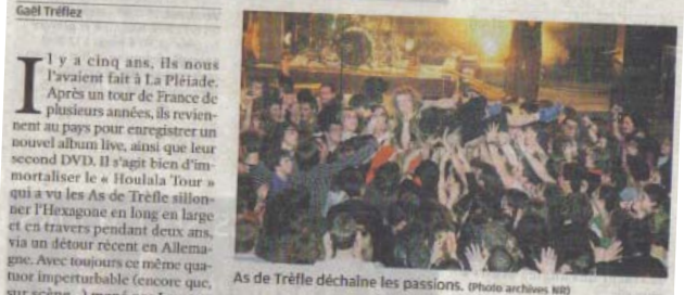
As de Trèfle déchaîne les passions.

I l y a cinq ans, ils nous l'avaient fait à La Piéride. Après un tour de France de plusieurs années, ils reviennent au pays pour enregistrer un nouvel album live. As de Trèfle a été accueilli par un public très nombreux.